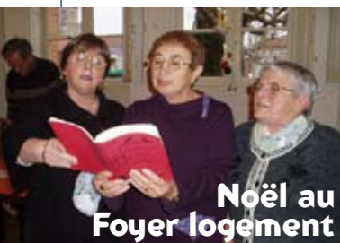
Noël au Foyer logement