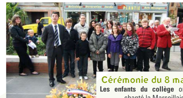
Cérémonie du 8 mai Les enfants du collège ont chanté la Marseillaise