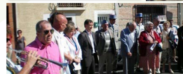
Cérémonie du maquis de Rieumes Muret Une cérémonie émouvante en présence de nombreux participants...

Le montant global des aides sollicitées par les associations dépassant 100 000 €, un arbitrage a été nécessaire. Après examen attentif des dossiers par la commission, le conseil municipal en séance du 24 avril 2010 a diminué le montant de la subvention pour certaines d'entre elles dont le dossier n'était pas complet, et pour d'autres qui disposent dans leurs réserves de plusieurs années de subvention municipale, voire de plusieurs années de budget de fonctionnement.