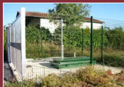
La tranche d'assainissement du Houns de la Costo et de la Fontagnères est terminée (photo du poste de relevage)