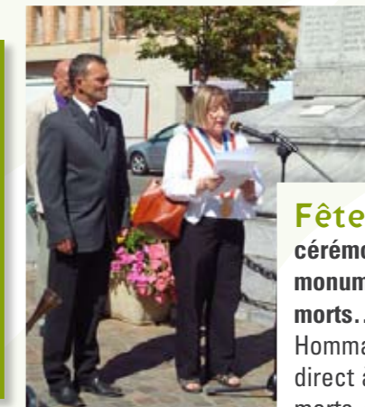
Fête locale cérémonie au monument aux morts...