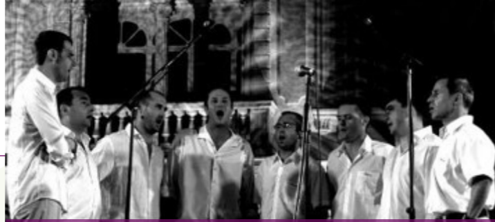
A l'affiche du jour le groupe polyphonique pyrénéen Balaguèra