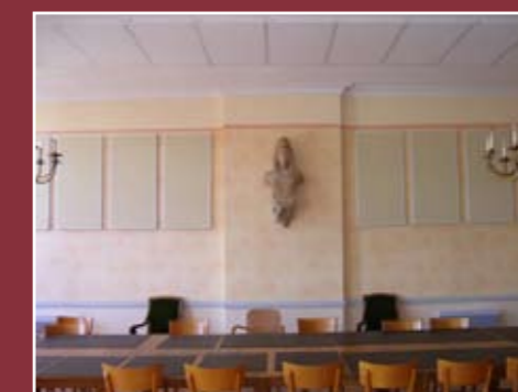
L'insonorisation de la salle du conseil municipal était nécessaire...