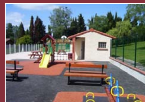
jardin d'enfants et aire multi-sports