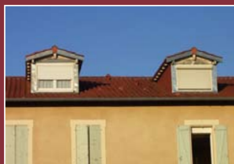
Les chiens assis et le toit de l'immeuble des Prunus sont restaurés