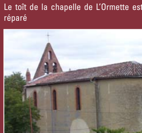
Le toit de la chapelle de l'Ormette est réparé