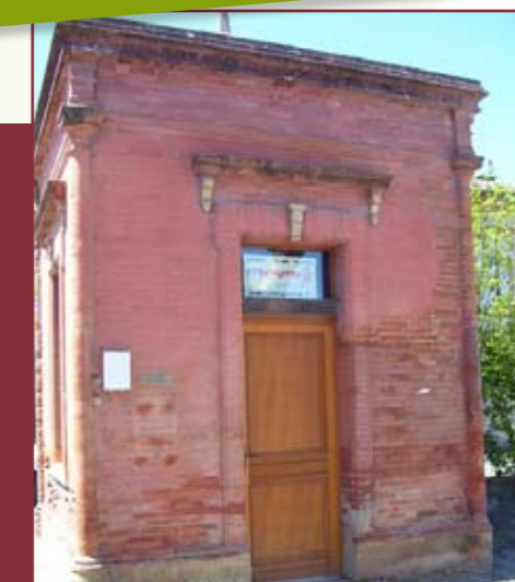
La bascule est devenue le bureau des « randonneurs », une fois achevé l'aménagement intérieur et remplacées les menuiseries...